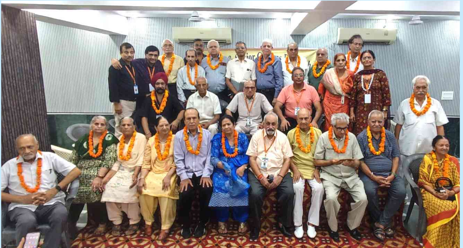
R&SCB honoured Golden agers on 1st October 2024 at S.D. Mandir, B-2 Block, Janak Puri, New Delhi